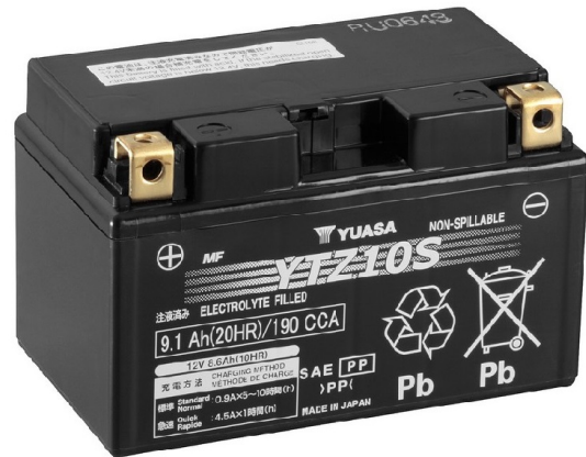
For Illustration Purposes Only