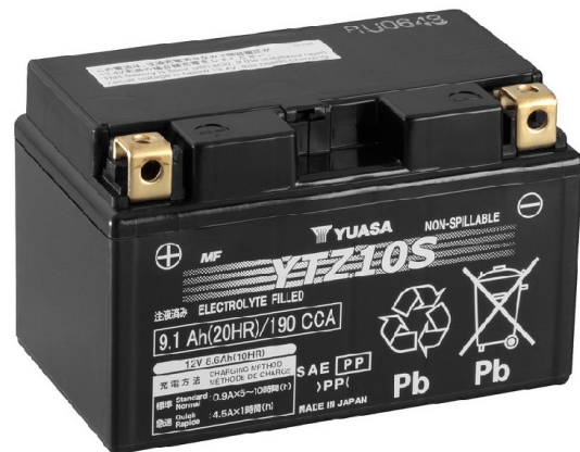
For Illustration Purposes Only